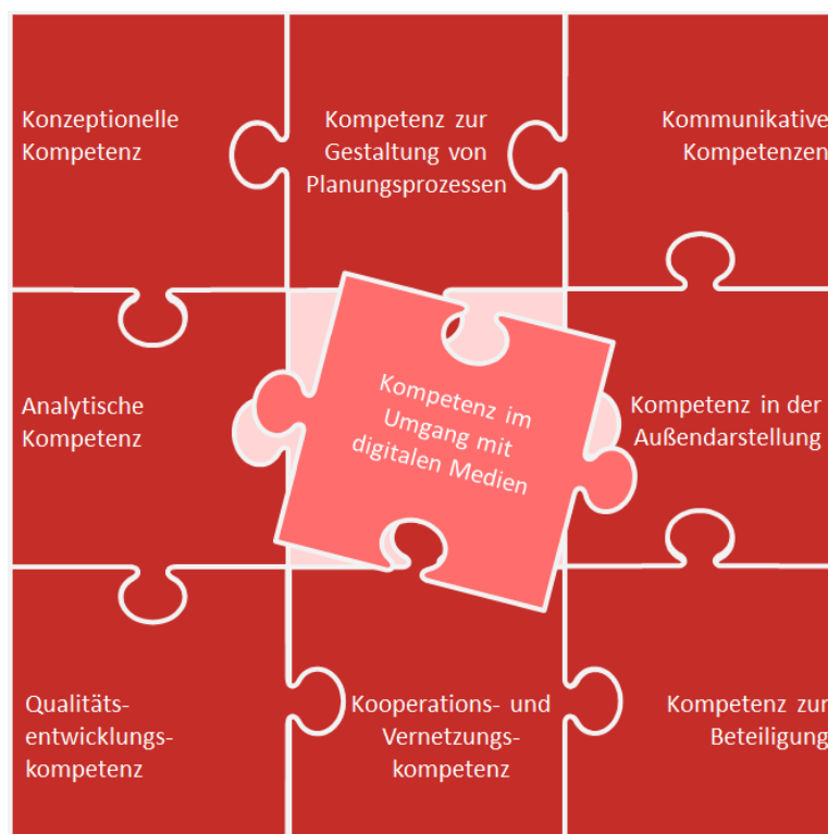
Abbildung 1: Kernkompetenzen einer Planungsfachkraft in der Jugendhilfeplanung, eigene Darstellung

Die Aufgaben einer Planungsfachkraft erfordern ein hohes Maß an fachlichen und administrativen Kenntnissen, sowie ein hohes Maß an methodischen und kommunikativen Fähigkeiten. Im Einzelnen lassen sich hier folgende Kernkompetenzen für eine Planungsfachkraft zusammenfassen: